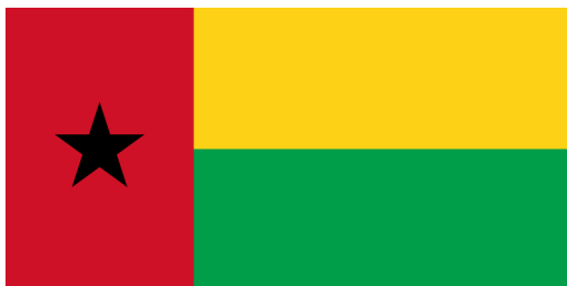
GUINEA BISSAU (AFRICA)